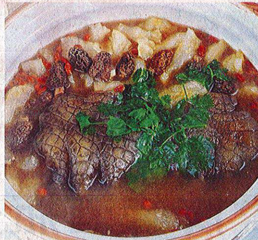
羊肚菌蹄筋鳄鱼掌