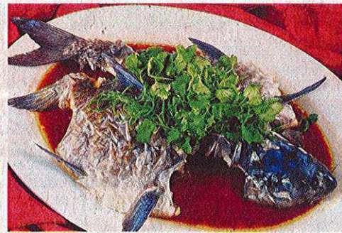
香港式蒸尊贵忘不了

过年年菜定少不了鱼生与盆菜，有别于以蔬菜为主的传统鱼生，长堤海鲜推出的“风生水起兴旺鱼生”就采用水翁、柿子、芒果、番石榴、柚子、凤梨、苹果等多种可口水果，配上传统鲜蔬，再加上酥脆马铃薯丝，无论口感或味道都丰富多层，爽口鲜甜。更值得一提的是，餐馆为