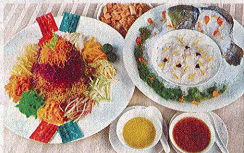
风生水起兴旺鱼生配名贵青衣生鱼片。